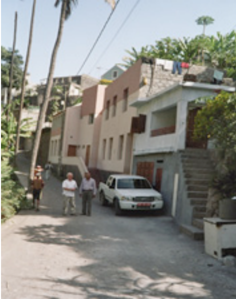
Centre médico social Chã de Pedras