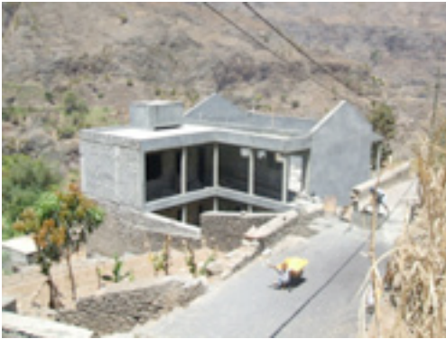
Centre socio-communautaire de João Afonso

En conclusion, je dirai que je suis très satisfait de l'avancée des projets constatée lors de mes deux visites. Les photos qui vous ont été remises témoignent de la bonne conduite de ces projets.