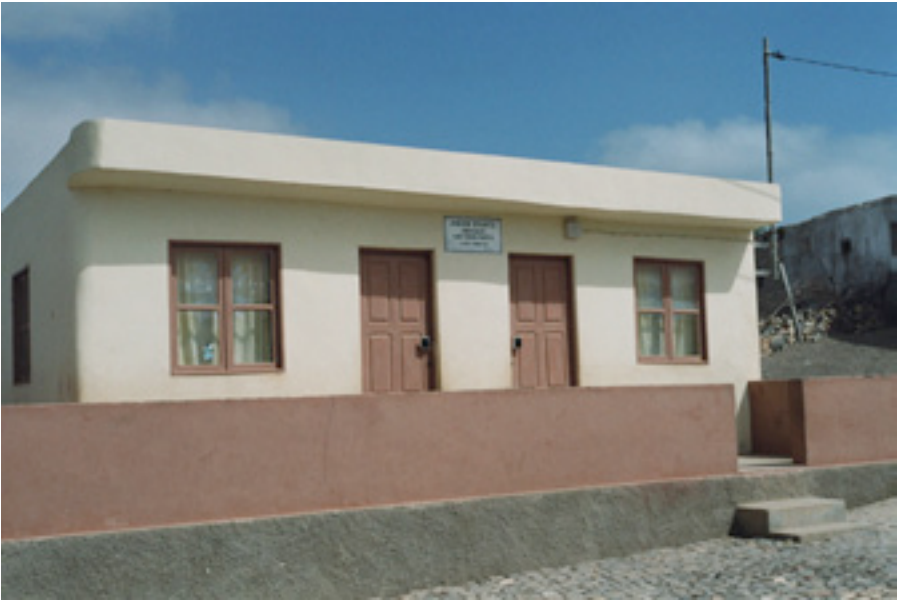
Jardin d'enfants de Pedro Vaz – Ile de Maio

Les enseignements que nous avons pu retirer suite à cette mission dans nos divers terrains d'action sur les îles de Maio, Fogo et Santo Antao, sont vraiment encourageants et positifs, aussi bien pour ce qui concerne l'évolution des projets que nos rapports avec les autorités locales.