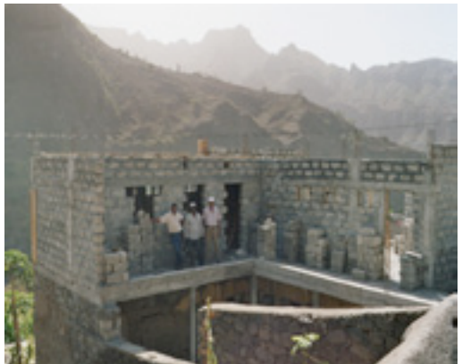
Centre socio-communautaire de João Afonso

Notre impression générale au sujet de ce projet est tout à fait favorable tant en ce qui concerne la qualité de la construction que la taille du Centre qui est proportionnée aux besoins d'une population d'environ 800 personnes disséminées dans la campagne environnante.