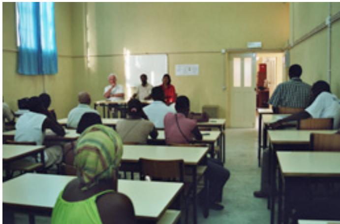
Salle de classe du Centre de Formation

Niveau 3 : (plus de 1200 heures de cours théoriques, pratiques et stages) Gestion comptabilité, Secrétariat, Tourisme et hôtellerie, Informatique