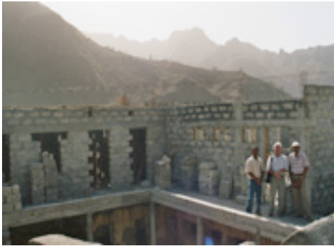
Centre socio-communautaire de João Afonso

Ce centre, dont notre association a décidé le financement le 14 avril 2006, est en construction sur les fondations d'une ancienne maison inhabitée que la commune a mise à disposition et qui se situe au bord du chemin très escarpé arrivant au village. Il comprend un Centre de santé, une Salle pour les réunions de la population et particulièrement des jeunes du village et des environs, ainsi qu'un local pour accueillir les enfants.