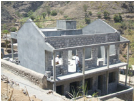
Centre socio-communautaire de João Afonso