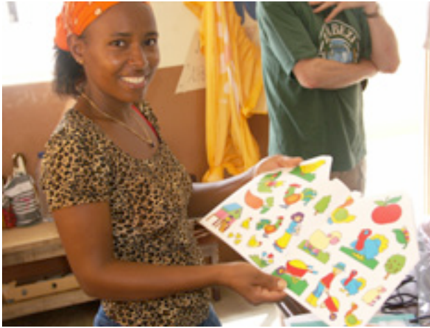
Apport de matériel scolaire en 2005

Nous avons également réalisé que nos actions, pour être menées à bien, nécessitaient un contact personnalisé avec nos interlocuteurs. C'est ainsi qu'à Maio et Santo Antao notamment, les bonnes relations avec les présidents des Municipalités sont vitales car ce sont des élus qui doivent rendre des comptes devant leur population, elle-même bénéficiaire de nos réalisations. Ce fonctionnement démocratique implique donc que les projets soient réellement utiles à la population qui est très attentive à ce propos.