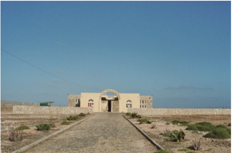
Vue d'ensemble du Centre de Formation de Maio