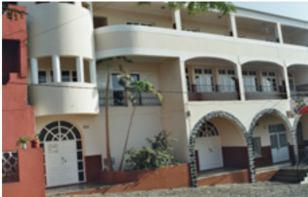
Centre coopératif de S.Filipe, Ile de Fogo

Le secrétariat du Centre est occupé par quelques secrétaires et visiteurs.